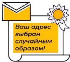
письмо по электронной почте