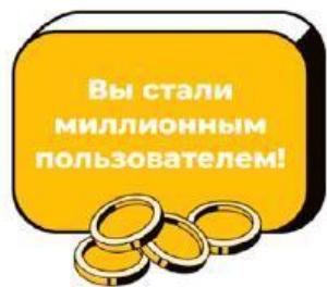
красочный баннер на сайте